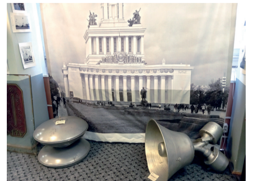
Такими громкоговорителями в свое время была оборудована вся территория ВДНХ.